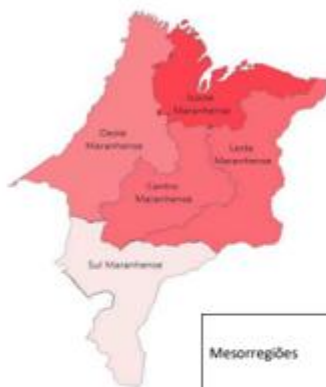
MESORREGIÕES MARANHENSES E PIB PER CAPITA